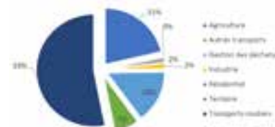
Répartition des émissions de Gaz à Effet de Serre (GES)

Ci-après un graphique montrant la répartition par type :