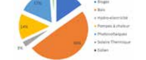
Répartition de la production d'énergies renouvelables

Ci-après un graphique montrant la répartition par type :