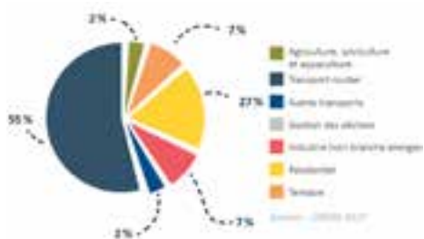
Répartition de la consommation énergétique

Ci-après un graphique montrant la répartition par type :